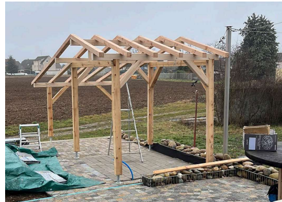
... démontage, livraison, remontage et finitions chez le client. Encore un client satisfait!