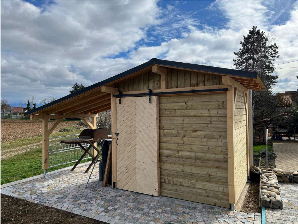
Création d'un abri de jardin sur mesure pour un client particulier.